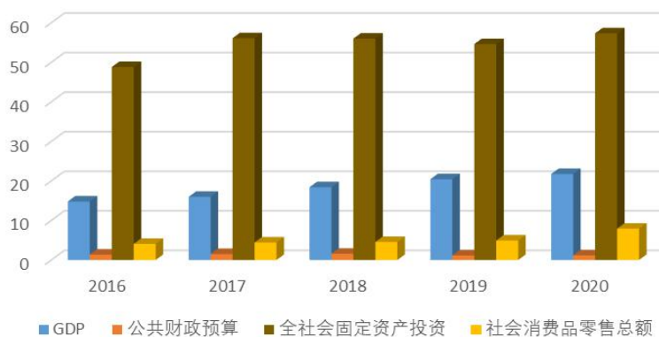
图 1-1 “十三五”时期泾源县主要经济指标变动情况

就业、增加农民收入的主要渠道，年度劳动力转移就业保持在 2.5 万人以上，实现工资性收入稳定在 5 亿元以上，全力提升泾源劳务品牌影响力。