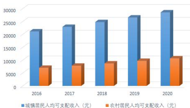
图 1-2 “十三五”时期泾源县居民收入情况