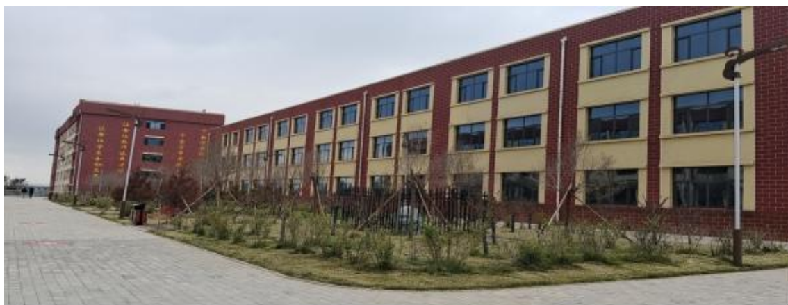
二期实验楼项目建设