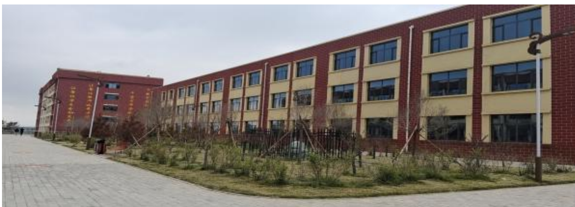
食堂及宿舍楼建设