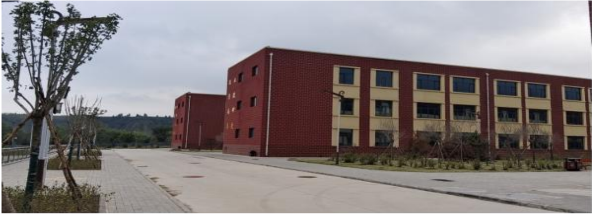
一期的 6 个单体楼建设